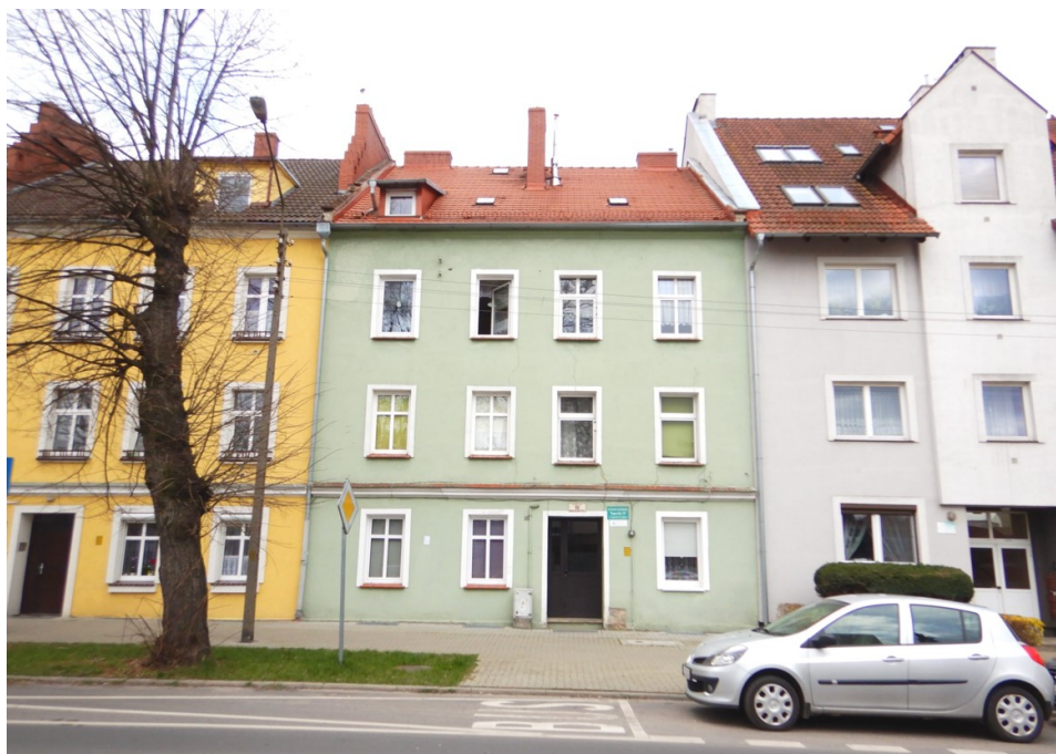
Ogólny widok budynku

na sprzedaż lokalu mieszkalnego Nr 7 znajdującego się w budynku położonym w Lubaniu przy ul. Mikołaja Kopernika 10 wraz z udziałem we współwłasności nieruchomości gruntowej (działka nr 19, AM 1, Obręb III o powierzchni 117 m 2 , JG1L/00015780/9)